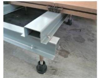
[ 転倒衝突時 硬さ試験 及び 下地断面 ]